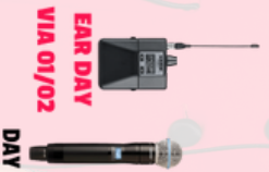
EAR DAY VIA 01/02 DAY