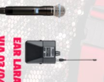
EAR LARA VIA 03/04