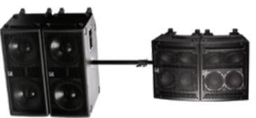
SIDE FILL L VIA 15