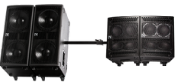
SIDE FILL R VIA 16